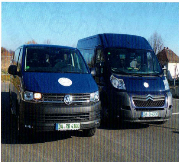
Das sind unsere Busse für den Fahrdienst

Vielleicht helfen Sie uns als ehrenamtlicher Fahrer dabei