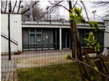
Vereinsraum im Hofgut Reinheim